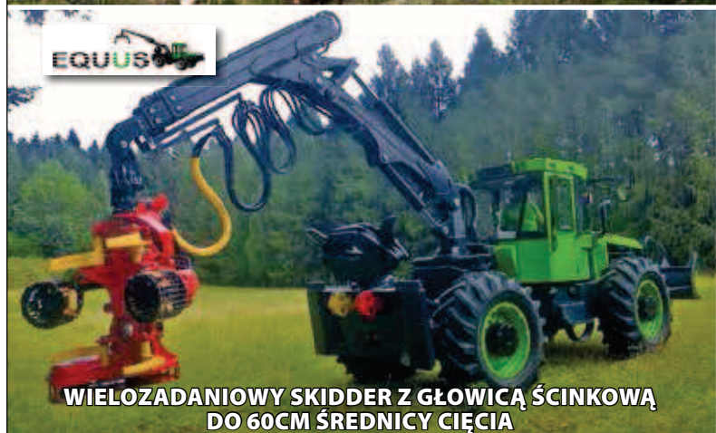
WIELOZADANIOWY SKIDDER Z GŁOWICĄ ŚCINKOWĄ DO 60CM ŚREDNICY CIĘCIA