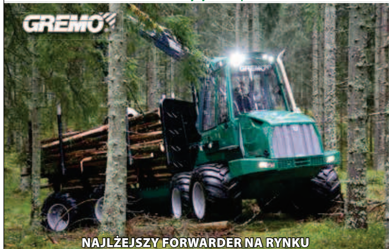
NAJLEPSZY FORWARDER NA RYNKU