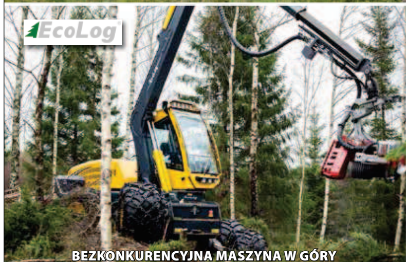
BEZKONKURENCYJNA MASZYNA W GÓRY