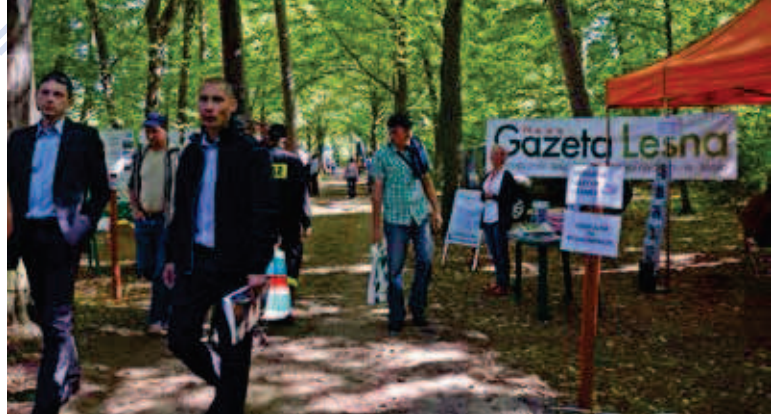
GAZETA LEŚNA na Targach

Redakcja GAZETY LEŚNEJ jak zawsze będzie na Was czekała przy pomarańczowym namiocie. Przyjdź, porozmawiaj z nami. Chętnie wysłuchamy Waszych opinii, propozycji, uwag. Jesteśmy dla Was.