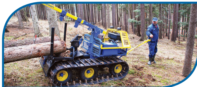
Żelazne konie do zrywki