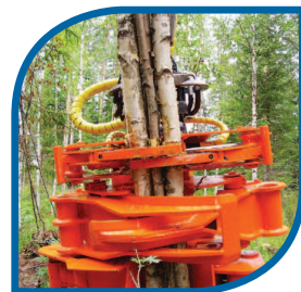
Głowice do pozyskiwania biomasy

Sprzedaż i serwis maszyn: Rottne, Biojack, Kapsen. Maszyny nowe i używane. Części do maszyn.