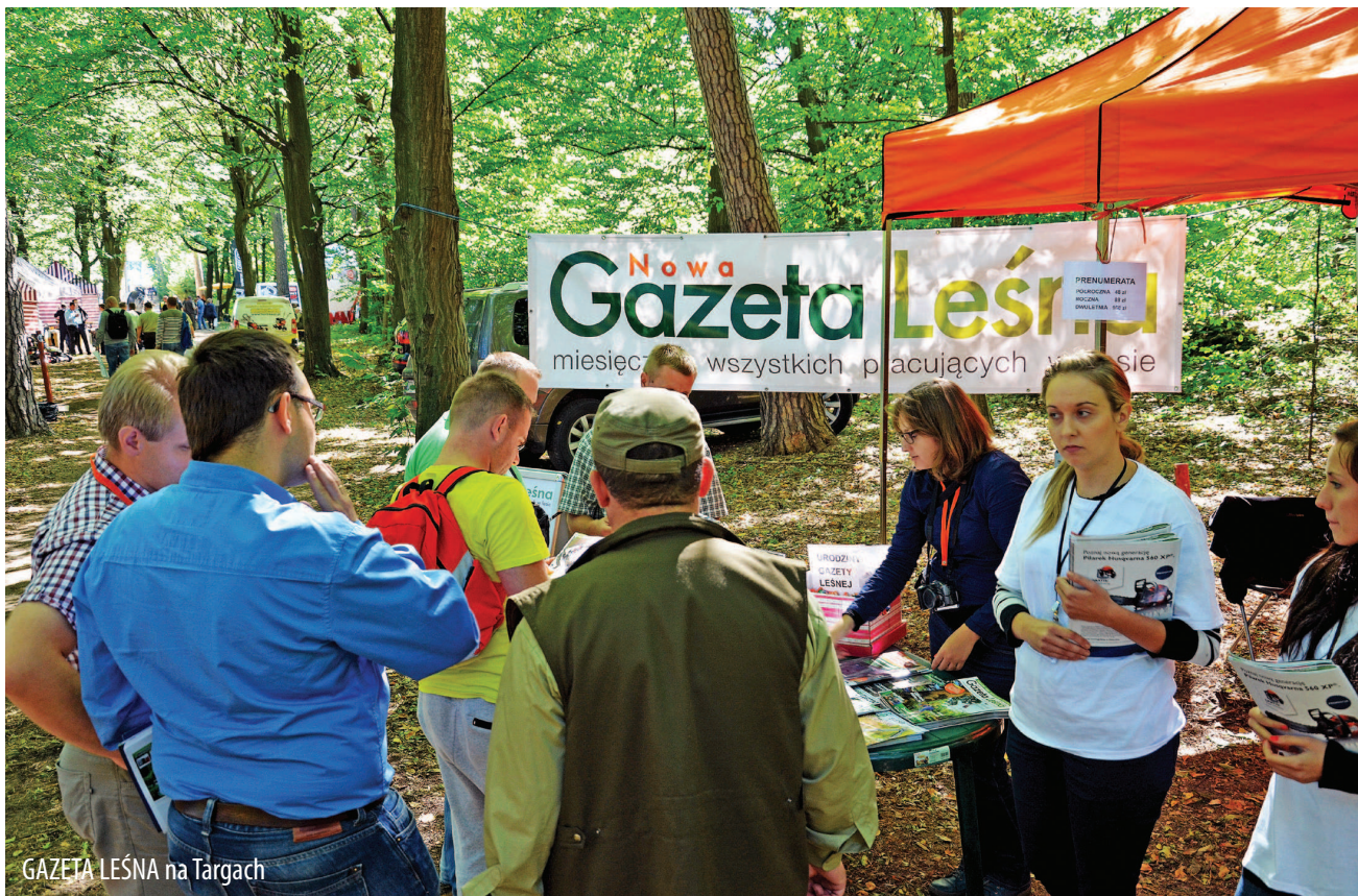
GAZETA LEŚNA na Targach

Redakcja GAZETY LEŚNEJ jak zawsze będzie na Was czekała przy pomarańczowym namiocie na terenie leśnej pętli wystawowej. Przyjdź, porozmawiaj z nami. Chętnie wysłuchamy Waszych opinii, propozycji, uwag. Jesteśmy dla Was.