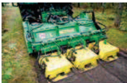
Rozdrabniacz RSD z płytami wyrównującymi PW

Rozdrabniacz bijakowy RB produkcji OTL przeznaczony jest do rozdrabniania odpadów pozrębowych bezpośrednio na powierzchni, jednakże w indywidualnych przypadkach znajduje bardzo szerokie zastosowanie m.in. w usuwaniu podszytów, odkrzewianiu całkowitym vegetacji leśnych (np. przepadłych upraw), pielęgnowaniu plantacji, czyszczeniu terenu pod liniami energetycznymi, likwidowaniu