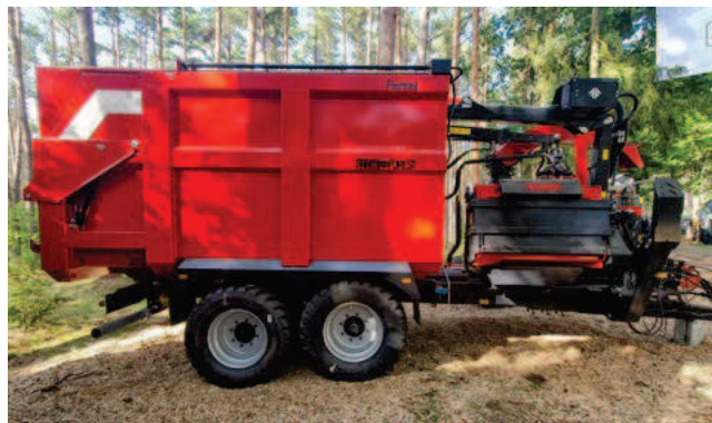
Farmi Forest COMBI

Farmi Forest to rębaki tarczowe, a proces zrębkowania obejmuje trzy etapy: cięcie zrębków, ich kruszenie w komorze rotora oraz przy ich wyrzucaniu. Ich podział również opiera się o rodzaj załadunku: ręczny lub żurawiem. Ładowane ręcznie wyposażone są w jedno