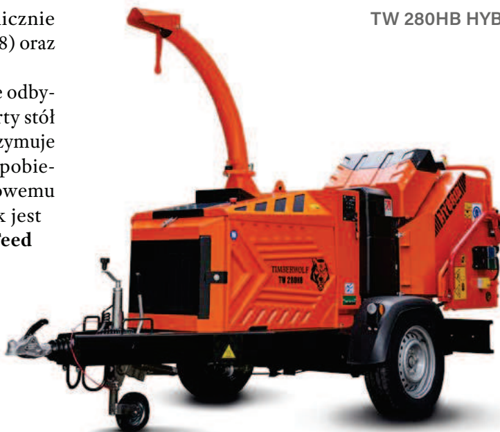
TW 280HB HYBRID

Kubota z bezobsługowym generatorowym silnikiem synchronicznym (GSM) z odzyskiem energii z rotora.