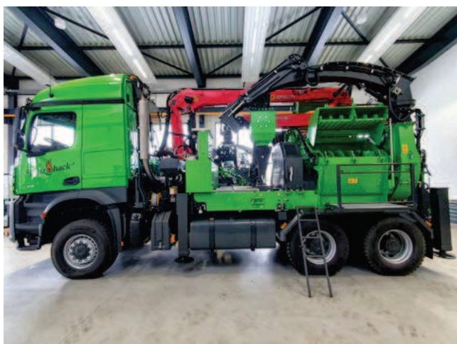
Heizohack HM14-860KL na podwoziu Mercedesa

Polski producent i dystrybutor maszyn, sprzętu i akcesoriów leśnych – Kompania Leśna, od 15 lat oferuje znane i sprawdzone produkty wiodących firm. Do takich należą: rębaki Heizomat, Farmi Forest oraz Timberwolf