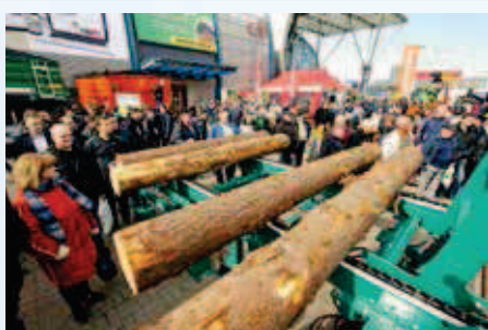
Na LAS-EXPO nie zabraknie najważniejszych firm polskiej branży leśnej

Targi Przemysłu Drzewnego i Gospodarki Zasobami Leśnymi