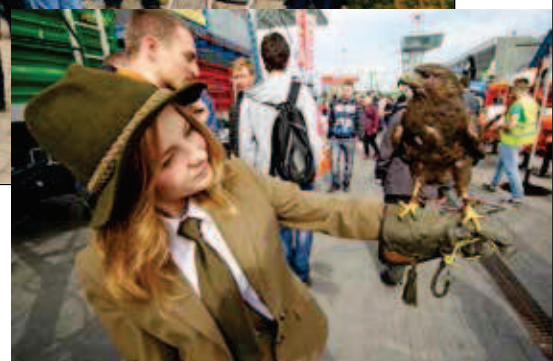
Charakterystyczne dla kieleckiej wystawy są występy Zespołu Sygnalistów Myśliwskich

Nie zabraknie firm polskiej branży, między innymi tych specjalizujących się w wy-