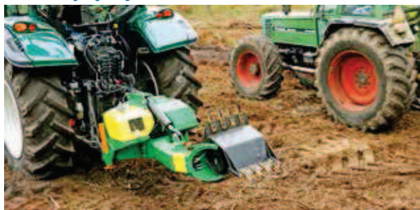
Ośrodek Techniki Leśnej, Jarocin

Przeznaczony jest do upraw na powierzchniach pozrębowych bez konieczności całkowitego uprzątnięcia pozostałości pozrębowych. Praca wałem polega na wykonywaniu prostokątnych placówek.