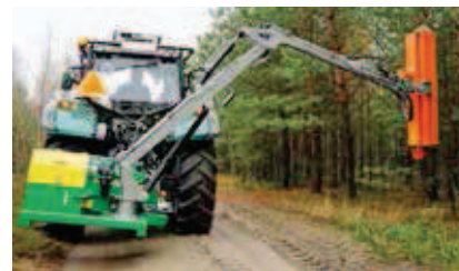
Ośrodek Techniki Leśnej, Jarocin

Uniwersalny rozdrabniacz do poboczy dróg leśnych i przycinania skrajni. Głowica bijakowa zawieszona jest na wysięgniku sterowanym hydraulicznie i pozwala na pracę w odległości do 4 m od osi ciągnika. Głowica tarczowa umożliwia przycinanie skrajni zgodnie z przepisami ppoż. dla dróg leśnych. Wymiana głowic, dzięki szybkołączom hydraulicznym, jest prosta i bardzo szybka.