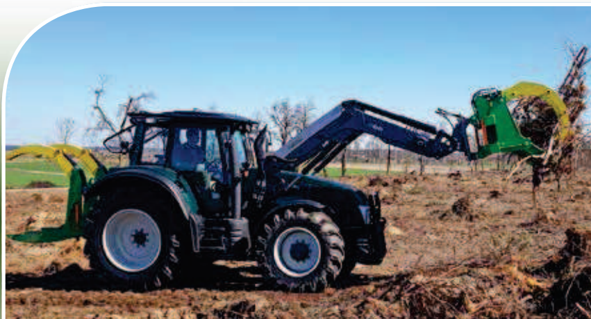
karczownik UKZ + zgrabiarka na ładowacz czołowy

Posprzątaj zręby przed jesienną orką z OTL Jarocin