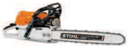
MS 462 C-M

Nowa Stihl MS 462 C-M to pilarka spalinowa stworzona dla profesjonalistów z branży leśnej. Jest to najlżejsza pilarka profesjonalna w klasie 70 cm 3 z doskonałym stosunkiem ciężaru do mocy (1,4 kg/kW). Urządzenie wyposażone zostało w innowacyjny, elektroniczny system sterowania pracą silnika M-Tronic z możliwością podstawowej kalibracji przez użytkownika. Pilarkę udoskonalono m.in. o: nowy system antywibracyjny, spłaszczoną, węższą i lżejszą pokrywę koła napędowego. Ponadto dzięki zastosowaniu nowego, lżejszego koła wentylatora znacząco zmniejszono oddziaływanie sił ży-