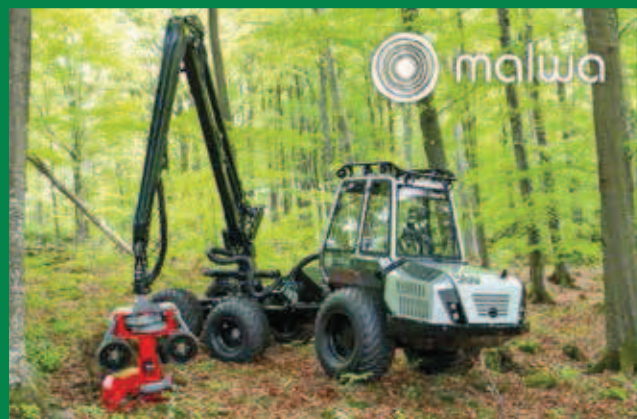
Maszyny do trzebieży wczesnych

Zapraszamy na nasze stoisko podczas targów EKO-LAS